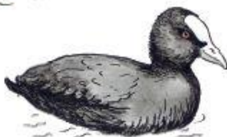
Lyska černá Fulca atra