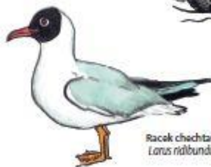
Racák chochtavý Larus ridibundus