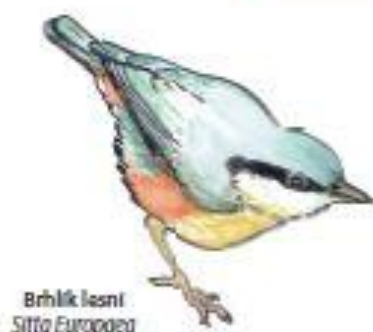
Brhlík lesní Sitta Europaea