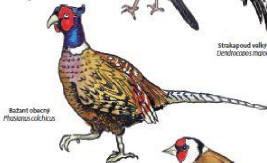
Bažant obecný Phasianus colchicus