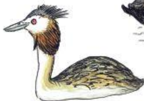
Potápka roháč Podiceps cristatus