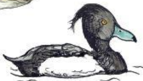
Polák chocholačka Aythya fuligula