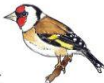
Stehlík obecný Carduelis carduelis