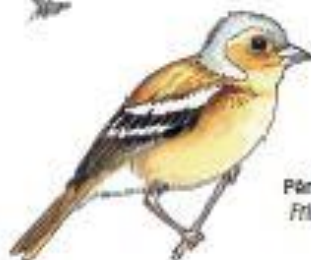
Pěnkava obecná Fringilla coelebs