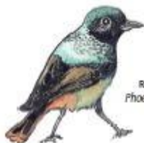
Rehák domácí Phoenicurus ochruros