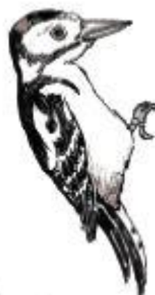
Strakapoud velký Dendrocopos major