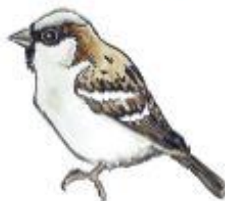
Vrabeč domácí Passer domesticus