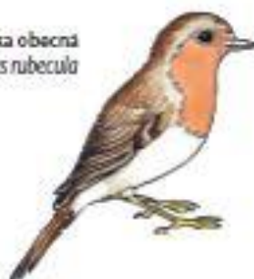
Červenka obecná Erithacus rubecula