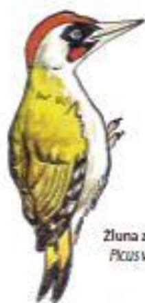
Zluna zelená Picus viridis