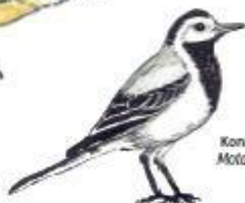
Kontopas bílý Motacilla alba