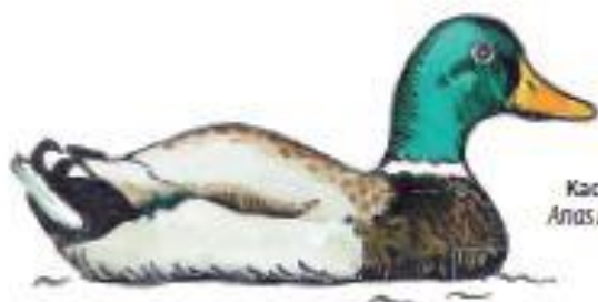
Kachna divoká Anas platyrhynchos