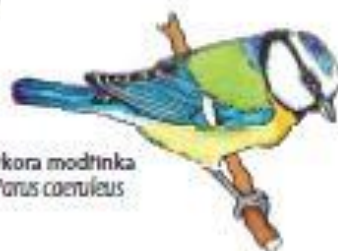
Sykora modřinka Parus caeruleus