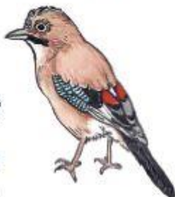
Sojka obecná Garrulus glandarius