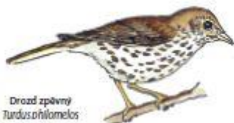
Drozd zpěvný Turdus philomelos