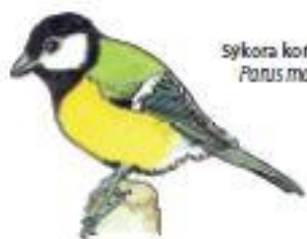
Sykora koňadra Parus major