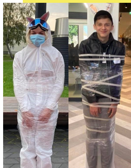
Meditsiinitöötaja ja oss häbi-postidel kvaliteetaega veetmas