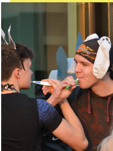
Värskendav hommikune hambapesu

Teisipäeval läks asi tõsiseks. Kooli tuldi teemakohastes riietes ning õpikuid veeti kastides. Bussiga saabujad said taluda veidi piinlikkust ning kaasreisijatelt ja bussijuh-tidelt lõbusaid pilke ja kommentaare. Hommik