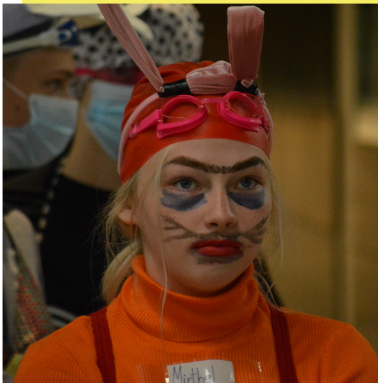
Kurb vigride meeskonnaliige kohutavalt ebamugava kostüümiga

Tagantjärgi muljetades jääb retsist vahva mälestus kogu eluks. Õpilaste sõnul olid kõige hirksamad snäkid ja maiustused just soolased beebitoidud, kaheksajalad ning teadmatu sisuga smuutid. Avaldati ka arvamust, et kostüümivalik oli veidi ebavõrdne. Näitena toodi, et dressides ossina oleks olnud palju mugavam kooli tulla kui lühikestes pükstes ning ujumismüts peas vigrina. Nii et Secunda, saate siit nii mõndagi endale kõrva taha panna! Suur aitäh Primale vägagi meeldejäeva retsi eest ning nüüd saame