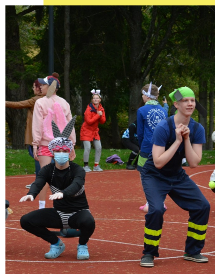
Sünkroonujuja ja maakas kükke tegemas

edasi, sest pool sellest trallist oli juba läbi. Neljapäeval toimus suurepärane tantsuvõistlus, mille võitsid Transhaldjad. Loomulikult ei puudunud päevast ka tervislikud smuutid ja vahepalad, mis palju eluvust tekitasid (ja ka okserefleksi). Kuklas küki-