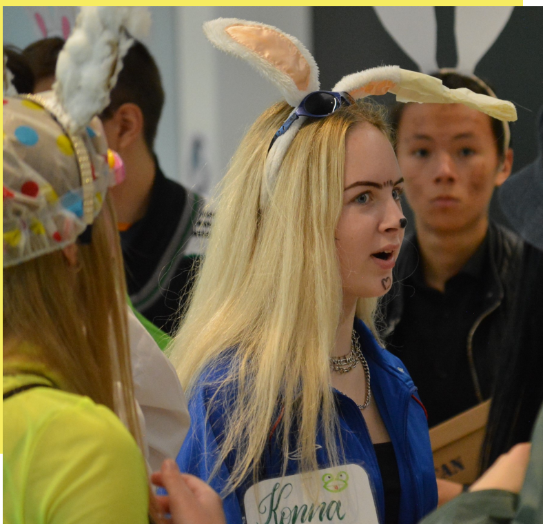
Rahulolev osside meeskonnaliige mugavates dressides

jääda ootama 2022. aasta sügist, mil praegune Tertia saab siis juba Primana teha kõike seda ka uutele värsketele Tertialastele!